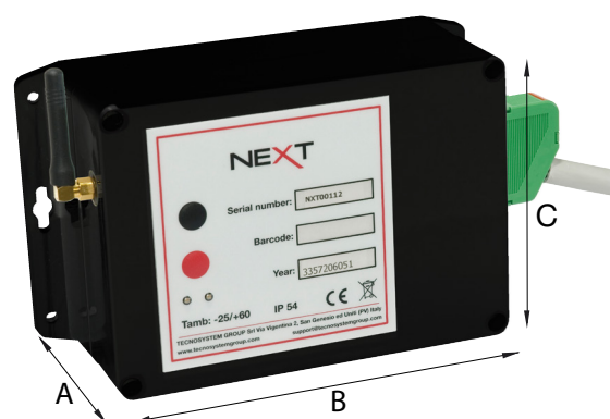
Figure 2 Dimensions de Next